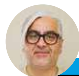
← Alejandro Villegas @lahoraoficial

El libelo se basa en cinco capítulos donde se le atribuye al titular de Vivienda y Urbanismo su responsabilidad en el "Caso Convenios".